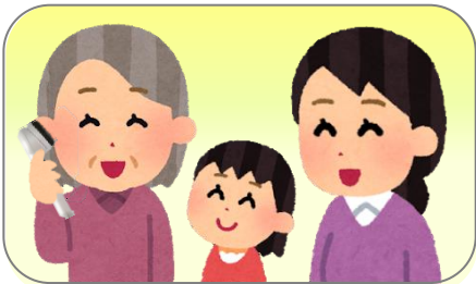
ご家族との会話の時に