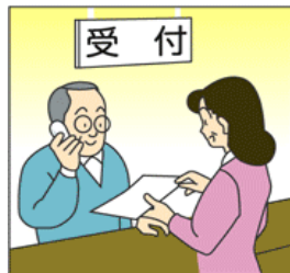
役所や銀行の窓口などで 会話が聞きづらい時に